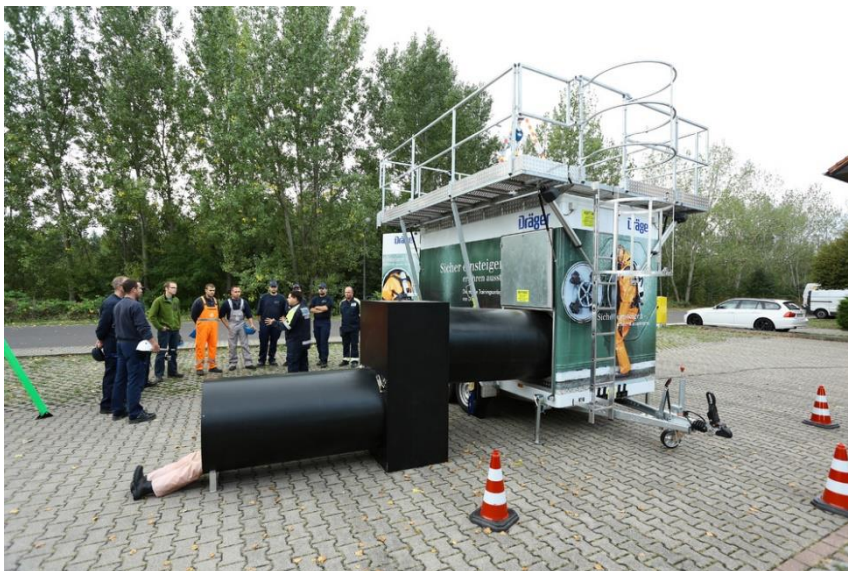
Mithilfe einer mobilen Trainingsanlage von Dräger Safety bietet der Technische Handel Rettungsübungen in engen und umschlossenen Räumen, Behältern und Schächten an.