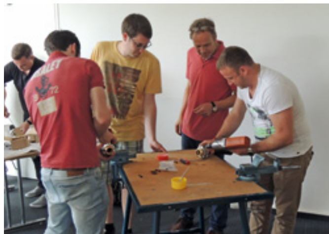
Fleißige Teilnehmer in der „Schlauchwerkstatt“