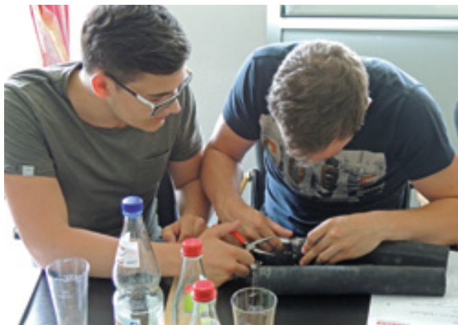
Die Teilnehmer begeben sich auf die Suche nach den metallischen Leitern eines M-Schlauches

Der erste Teil des VTH-Lehrgangs „Geprüfter Fachberater für Schlauch- und Armaturentechnik“ fand vom 5. bis 10. Juni 2016 in Bad Hersfeld statt. Das Seminarkonzept der VTH-Fachgruppe „Schlauch- und Armaturentechnik“ ist ein voller Erfolg - die elfte Auflage war mit 29 Teilnehmern aus 19 Mitgliedsfirmen erneut ausgebucht.