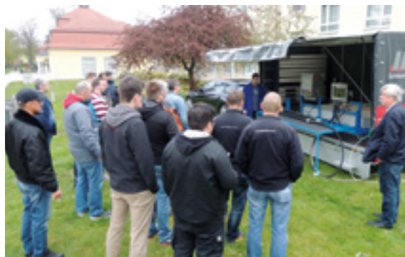
Von der Theorie zur Praxis - Schlauchprüfung vor Ort