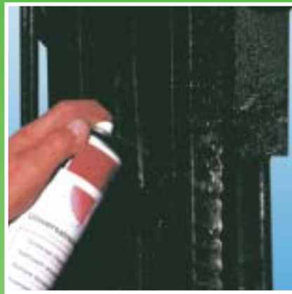
Reinigungsmittel: beseitigt Ablagerungen, stellt Beweglichkeit wieder her.

Für praktisch jede Anforderung hat der Technische Handel das passende chemo-technische Produkt. Als Mittler von der Anforderung zur Problemlösung, zwischen Anwender und Zulieferindustrie hat er nicht nur den Überblick über das differenzierte Angebot. Er berät auch bei der Suche nach dem maßgeschneider-