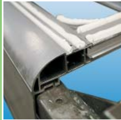
Klebstoffe: halten, was sie versprechen.