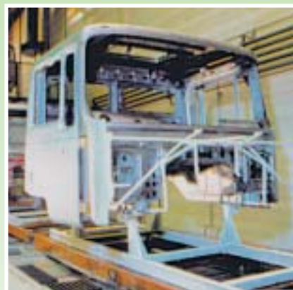
Korrosionsschutz: „eingebauter Werterhalt“.