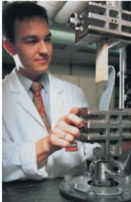
Geprüft: Zug- und Scherfestigkeit