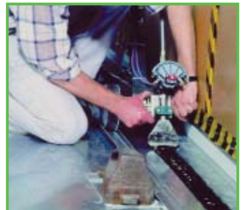
Klebstoffe: auf die Schiene gebracht.