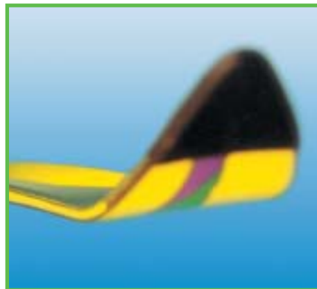
Klebstoffe: Die „modernste“ Fügechnik ermöglicht elastische Verbindungen.