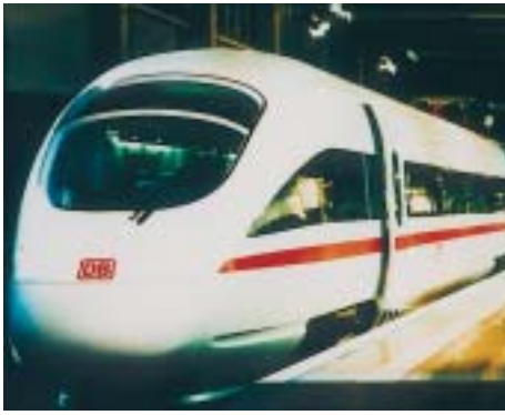
Klebdichtstoffe: unscheinbar, aber wichtig für Reisen ohne störendes Fahrgeräusch.

ten Produkt. Wenn er nicht auf Lager hat, was Sie benötigen, besorgt er, was Sie brauchen. Und wenn es für Ihre spezielle Problemstellung noch keine Problemlösung gibt, vermittelt er den Weg zur Entwicklung einer neuen Lösung.