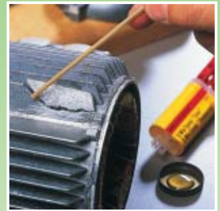
Klebstoffe: „retten“ formstabile Teile als auffüllende Vergußmasse.