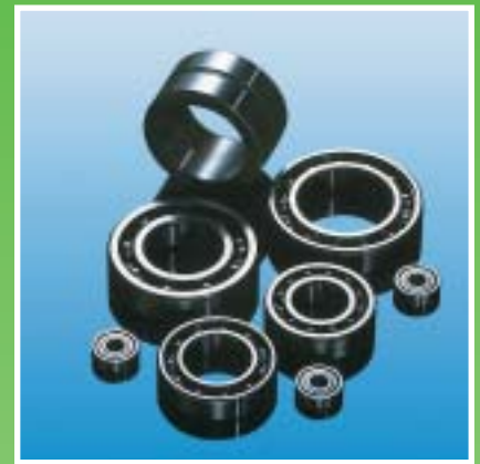
Schmierfette: stellen sicher, daß alles „rund läuft“.