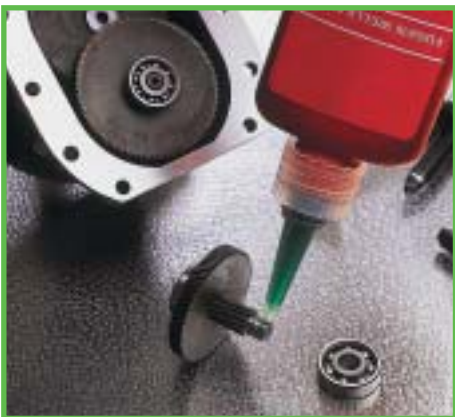
Fügeprodukte: befestigen Wälzlager auf der Welle.

Unser Anspruch: Geht nicht gibt's nicht.