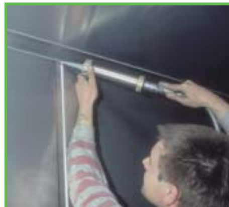
Dichtstoffe: Fuge - kleines Detail mit großer Wirkung.