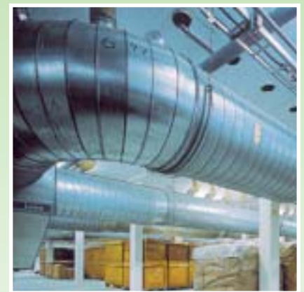
Dichtstoffe: kein Leck in der Klimatechnik.