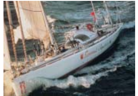
Klebdichtstoffe: halten Isolierschichten auch bei Höchstbeanspruchung zusammen.

Spezialschmierstoffe stellen in der Schmierungstechnik sicher, daß alles glatt läuft. Korrosionsschutzmittel tragen bei Lagerung und Versand dazu bei, daß alles funktionsfähig bleibt. Lärmdämmstoffe reduzieren die Maschinendröhnung in der Produktion. Spezialreinigungsmittel ermöglichen zum Beispiel in der Schlauch- und Armaturentechnik, daß alles sauber bleibt. Silikonprodukte werden unter anderem als Schutz- und Pflegemittel in der Kunststoff- oder Gummitechnik eingesetzt. Dazu kommt der große Be-